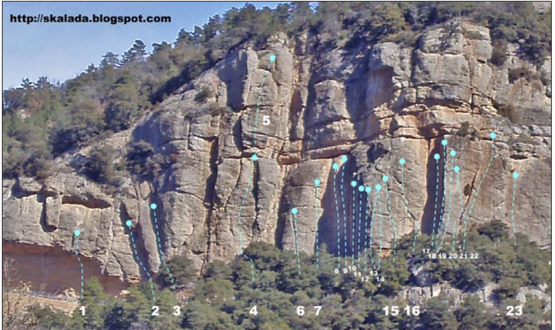
vista frontal amb les vies